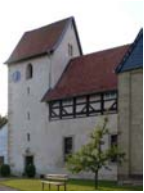
St. Laurentius-Kirche Kaierde (Delligsen)