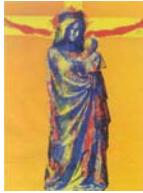
Katholische Kirche Bad Gandersheim