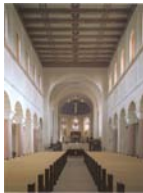
Stiftskirche (Dom) Bad Gandersheim